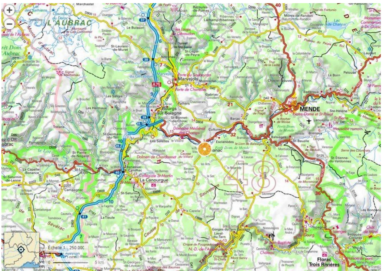
Illustration 1: Plan de situation de la commune de Chanac (48).

Elle se situe le long de la vallée du Lot et traversée par la route nationale RN88 reliant Mende à l'autoroute A75 qui permet d'accéder vers le nord à Clermont-Ferrand et au sud à Millau et Montpellier. Elle est desservie par la ligne de chemin de fer la Bastide – le Monastier qui permet de rejoindre la ligne Béziers – Neussargues au Monastier.